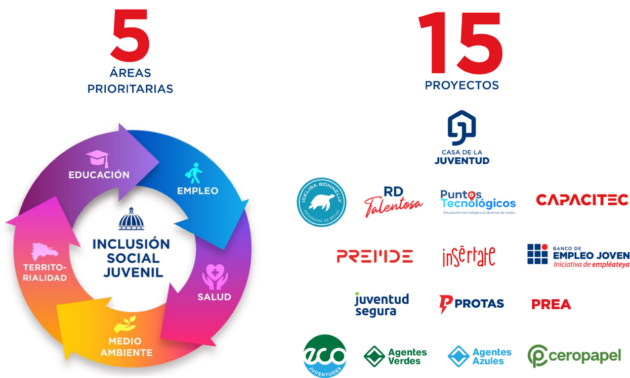
Figura 2: Inclusión Social Juvenil y su vinculación con el Ministerio a través de los Proyectos presentados en el PEI 2021-2024

Fuente: Elaboración propia con datos de la Dirección de Planificación y Desarrollo.